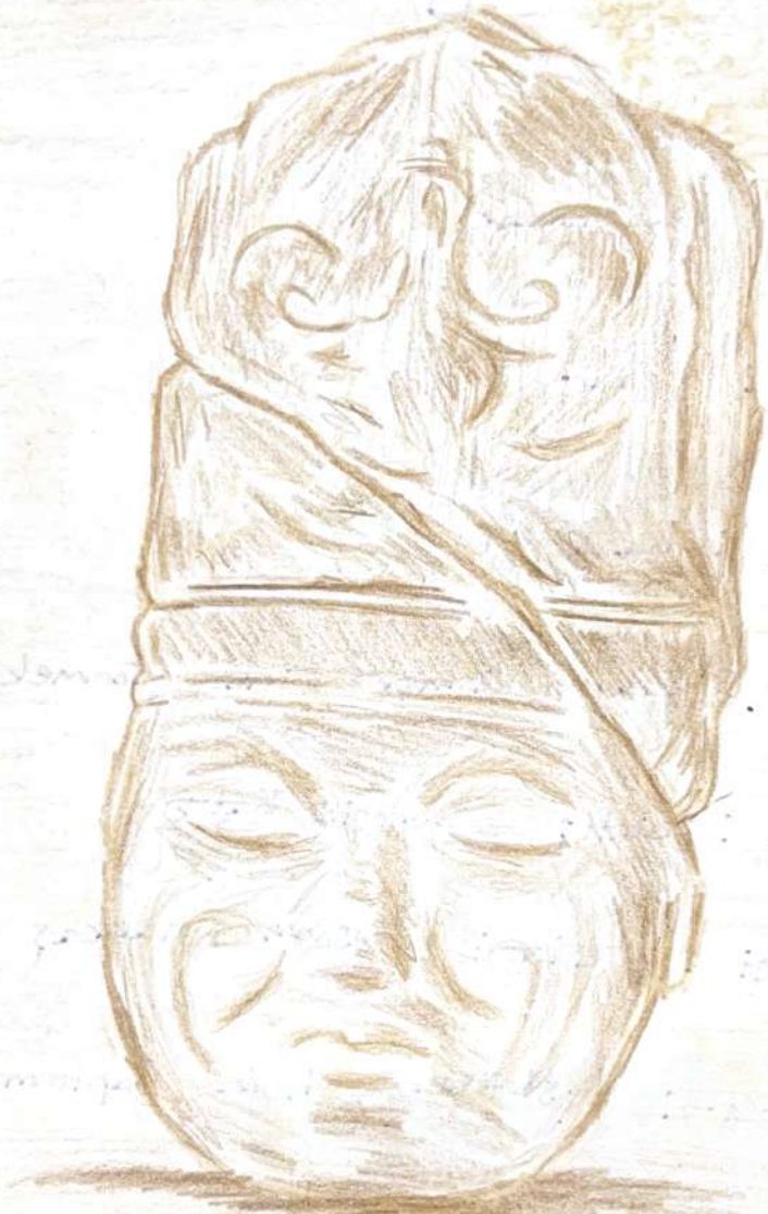
Kül Tigin Heykelinin başı