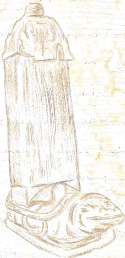
Bilge Kagan Minyatürü